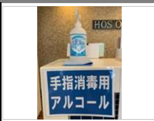
アルコール消毒液の設置