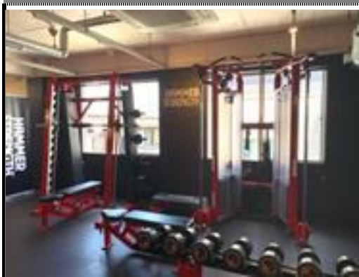
各エリア換気機器能力の向上 1時間あたり3回以上の空気の入替