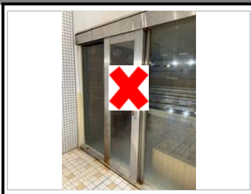
サウナの利用中止