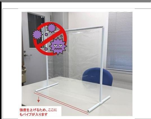
フロント対応の飛沫予防 ※飛沫感染対策