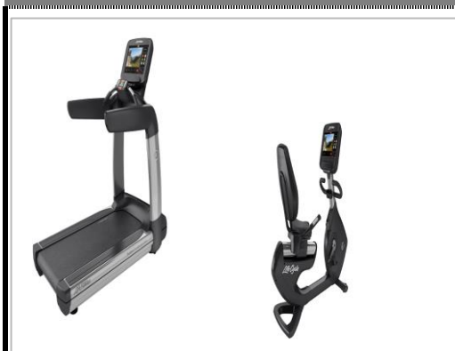
マシン機器のアルコール清掃徹底 ※一部利用の制限