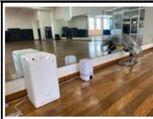
スタジオ空気清浄・除菌噴霧器の設置