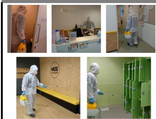
館内の消毒の実施