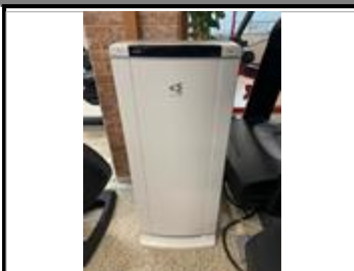
マシンエリア高性能空気清浄機設置