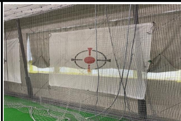
ゴルフレンジ内の換気 ※窓・入口の開放