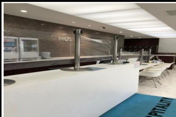
フロント対応の飛沫予防 ※飛沫感染対策