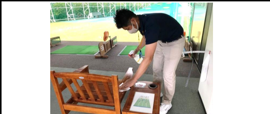
打席ご利用前後にはイス・テーブル ボールカゴなどの消毒徹底