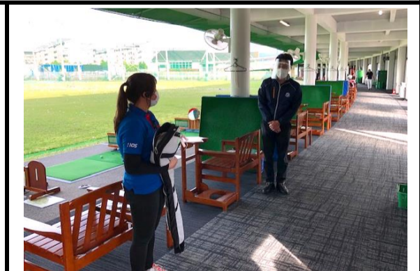
デモンストレーション時、実技指導時、レッスン終了時のお見送りも、フィジカルディスタンスを保ちます